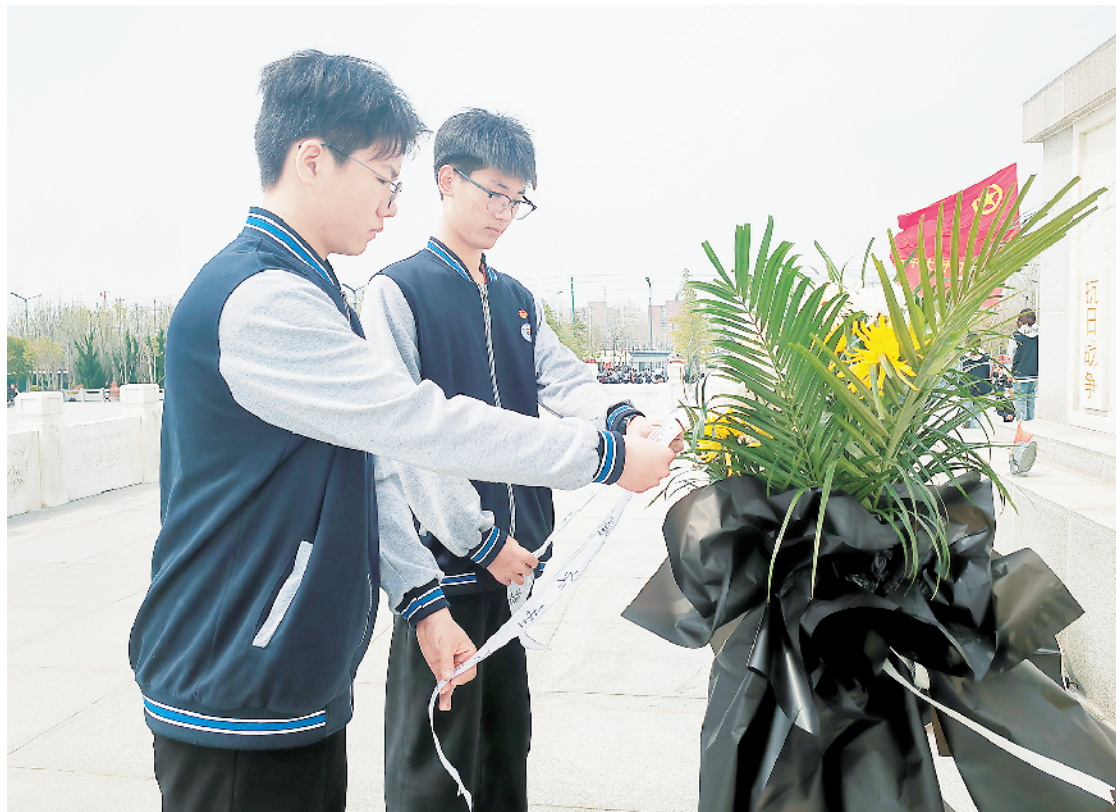
学生向革命先烈敬献鲜花。