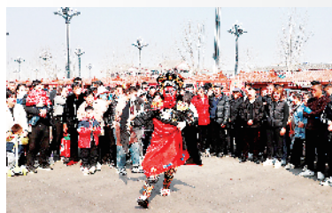
艺人表演变脸绝活。