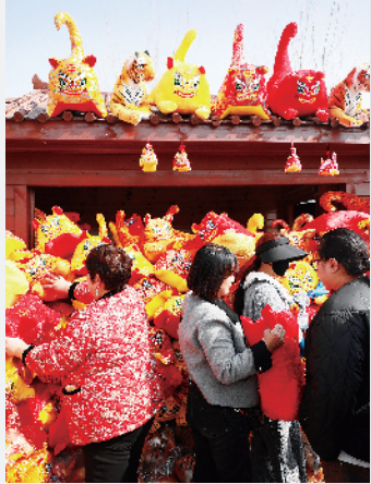
非遗产品布老虎热卖。