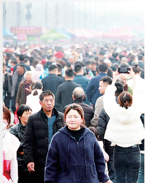
人流如织，热闹非凡。