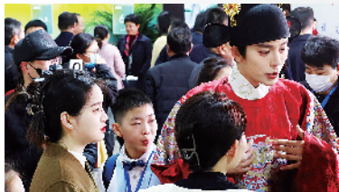
网红天阳(着古装者)逛庙会。