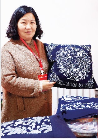
非遗产品故道家纺。