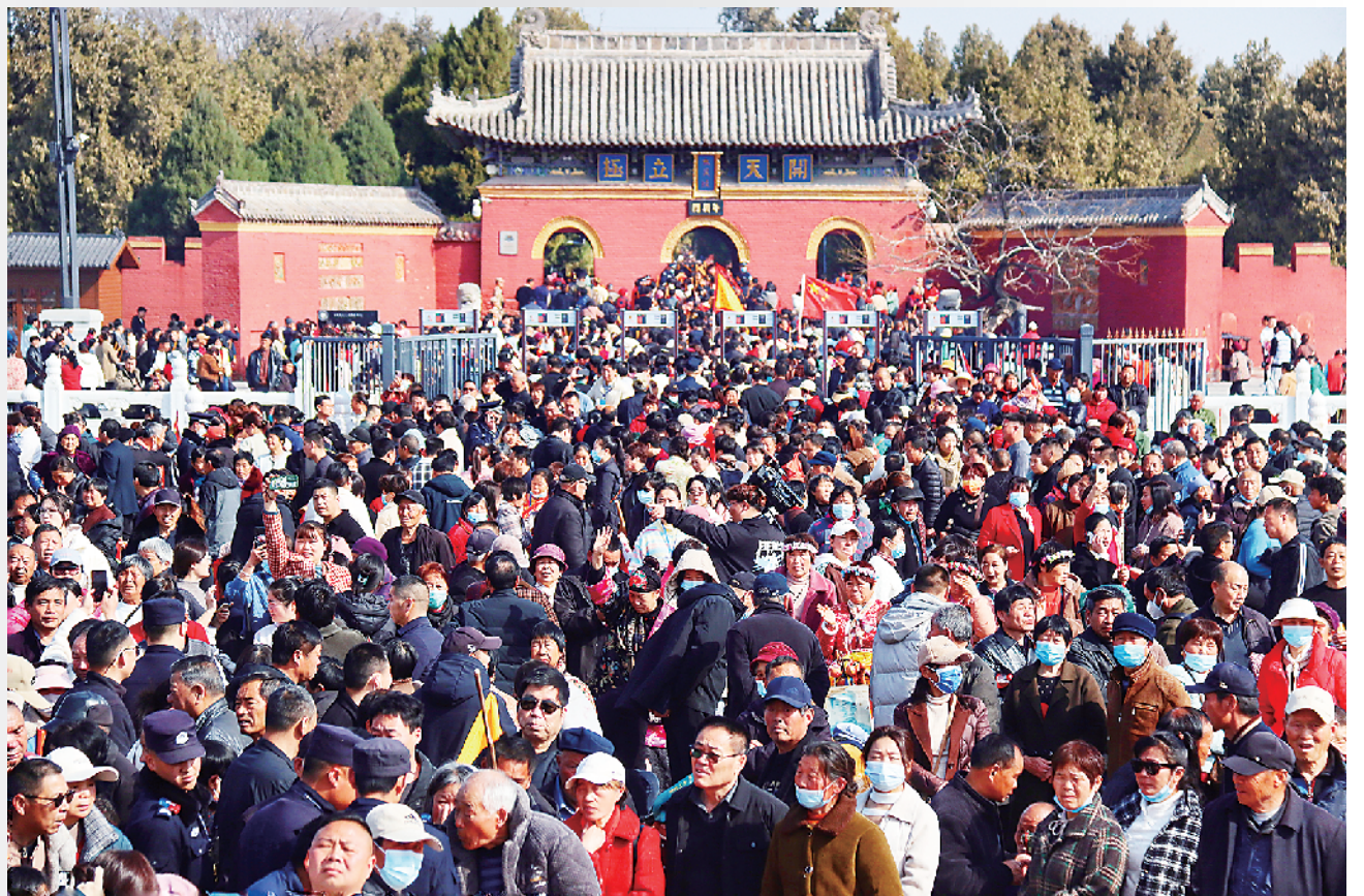
人山人海，蔚为壮观。