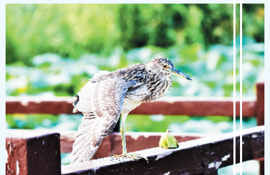
小憩中的夜鹭亚成鸟。