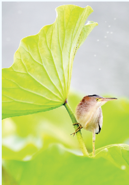
黄苇鸭在荷叶下休息。