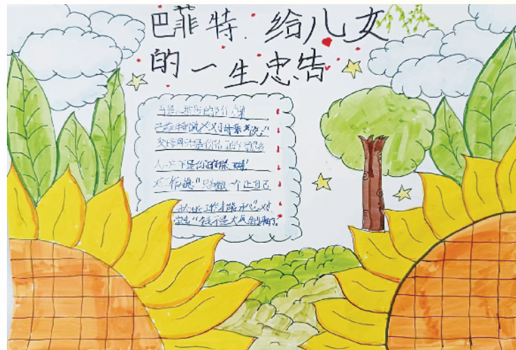
小记者:许靖晗 五(1)班 (辅导老师:李萍)