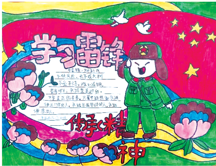
小记者:姜珊 二(3)班 (辅导老师:石继红)