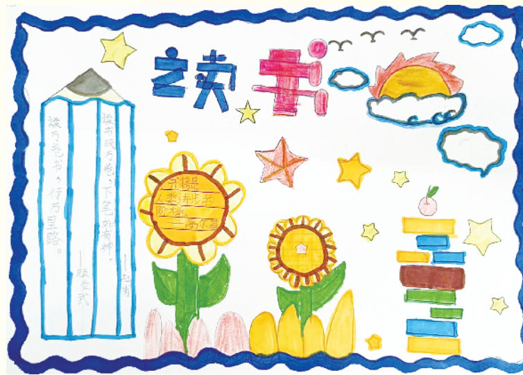
小记者:程莞茹 二(1)班 (辅导老师:高梦芹)