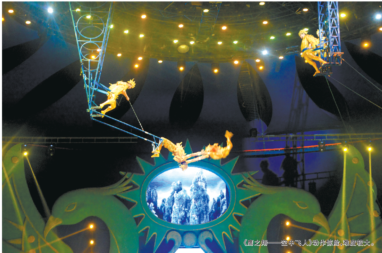
《鹰之翔——空中飞人》动作惊险,难度较大。

这恰恰反映出杂技在周口的普及现状:很多人只知道周口野生动物世界,却不知道它仅是周口杂技文化产业园的一部分。2004年,周口被评为全国唯一的地市级“中国杂技之乡”。可十多年过去了,周口杂技依然面临“墙内开花墙外香”的处境:虽然在全国各地的演出热热闹闹,但很多周口人并不知道“周口杂技”的地位和影响力,甚至不知道“杂技”这张周口文化名片的分量。2021年11月,周口杂技文化产业园成立,地市级“中国杂技之乡”有了基地,也为周口人认识杂技、了解杂技开辟了窗口。