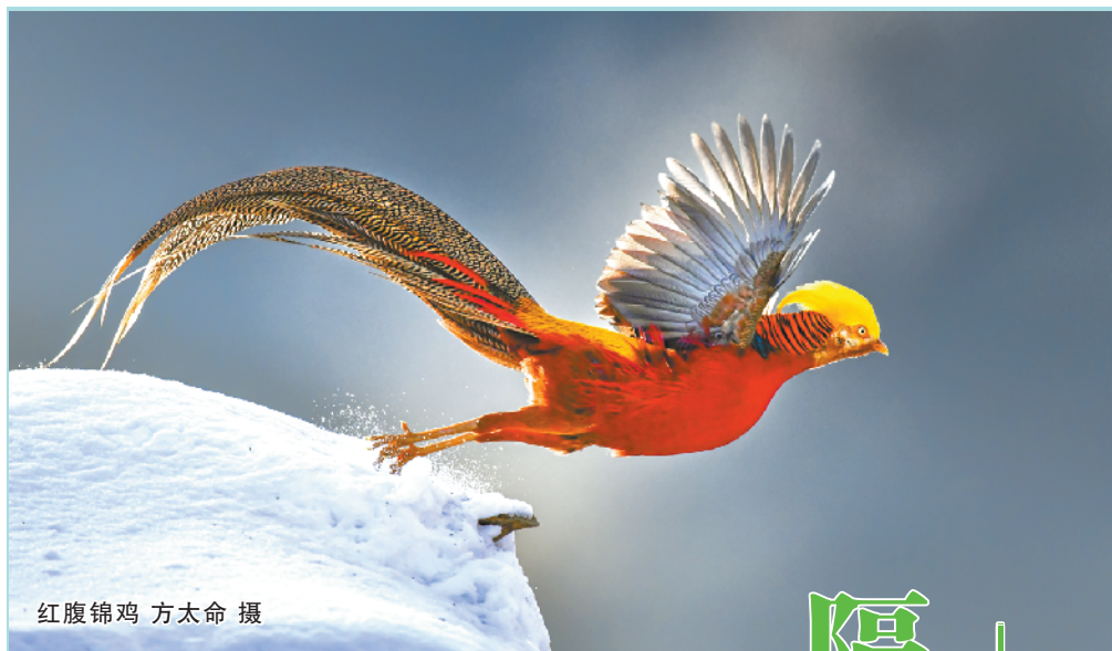
红腹锦鸡