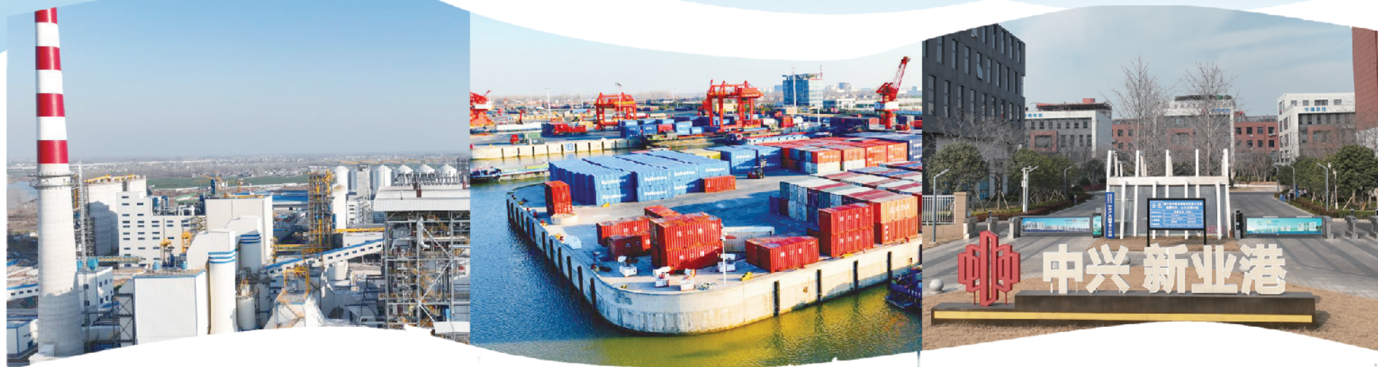
益海嘉里(周口)现代食品产业园厂房林立。