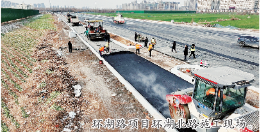
环湖路项目环湖北路施工现场。

汽养护机、蒸汽锅炉等防寒保暖设备,严格落实冬季施工质量安全管控措施,确保工程质量安全。据了解,为加快推进项目建设进度,市住房和城乡建设局还建立了“日调度、日研判、日报告、日总结”工作机制,全力保障项目顺利推进。“下一步,我局将进一步加快建设进度,确保项目早日建成通车,以高质量的优良工程交给群众一份满意的答卷。”付国斌说。