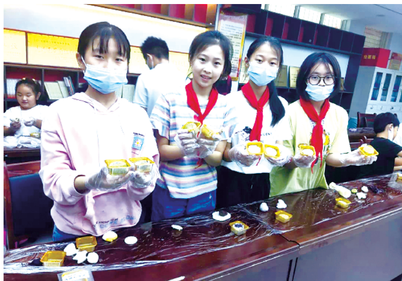
9月9日上午,周口市文昌小学社工站举办“喜迎中秋、共度佳节”月饼DIY活动。志愿者们把桌布、馅料、面粉、模具等工具材料准备妥当,同学们亲手学做月饼,体验做月饼的乐趣。学生们把自己亲手做的月饼小心翼翼地装入月饼盒中,有的学生并表示要带回家和家人一起分享,有的学生表示要让老师尝尝自己的手艺。②2

客户不少。”馨丽康城营销经理张峰忙着往售楼部带客户,一脸兴奋。总的情况是,绝大部分参展楼盘都有成交,积累了不少真正客户,万科在开幕式当天上午就接待两组客户,基本成交。 在周口城投展厅,张继宏与置业顾问认真交流。“周口楼市是否触底”“房价定位与市场把控”“近期周口房产新政与金融救市政策”……他对市场专业而又通俗易懂的分析让置业顾问信服,让房地产行业人员干劲倍增。“这次房交会,不论是规模,还是效果,都好于预期,周口报业传媒集团组织的房交会不愧是‘周口第一展’,名副其实。”张继宏评价道。②16