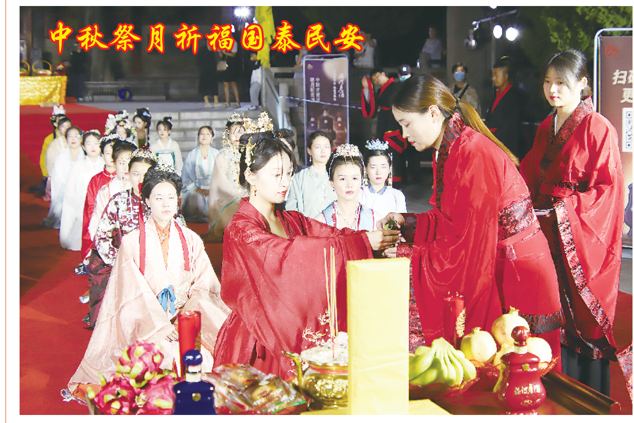
9月10日晚,鹿邑县在老子诞生地太清宫景区隆重举行“中秋祭月祈福大典”暨传统民俗活动,新华网进行了全程直播。 活动现场,来自鹿邑县社会各界的汉服爱好者,身着端庄华美的礼制汉服,通过“献祭舞乐”“三献诵读”等礼仪,分别为大家展现了国家级非遗项目“老子祭典”和传统民俗“中秋祭月”等仪式,再现了中华传统文化祭祀礼仪之美,体现了老子故里百万人民对祖国昌盛、人民安康的共同祝愿,为欢度中秋佳节、喜迎党的二十大召开营造了浓厚氛围。 据了解,此次中秋祭月民俗活动已是第二届,如今该县中秋祭月民俗活动与端午、重阳等传统节日礼仪活动已成为弘扬传承中华优秀传统文化、彰显老子故里独特魅力,营造“道德名城、魅力鹿邑”浓厚氛围的文化品牌。②10