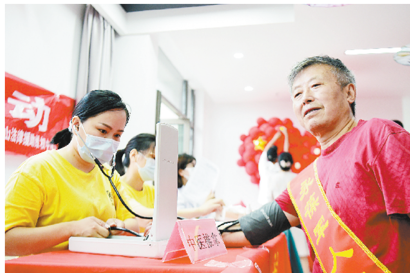
志愿服务 关爱老兵

中央宣传部发出通知,要求各级党委(党组)把《纲要》纳入学习计划,全面系统学、及时跟进学、深入思考学、联系实际学,坚持不懈用习近平新时代中国特色社会主义思想武装头脑、指导实践、推动工作,自觉做习近平生态文明思想的坚定信仰者和忠实实践者,不断开创新时代生态文明建设新局面,为全面建设社会主义现代化国家、夺取新时代中国特色社会主义伟大胜利、实现中华民族伟大复兴的中国梦不懈奋斗。