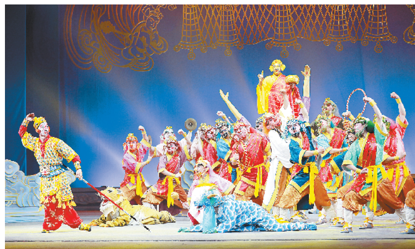
大型秦腔神话剧《西游记之大闹天宫》西安首演

六大主体活动之一的全国演艺及文创产品博览会将于9月2日至4日在天津国家会展中心举办。博览会聚焦文艺精品创作和演艺产业发展,展示艺术发展成就和产业发展成果,旨在促进线上线下联动,推动演出直播创新,搭建展示全国演艺及文创产品发展成果的高水平盛会和互利共赢的合作舞台。